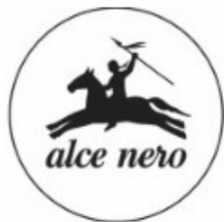
Alce Nero s.p.a.

Le aziende sostenibili possono essere piccole, medie o grandi ma devono avere chiare strategie sostenibili e adottare comportamenti coerenti e non episodici