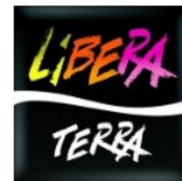
Libera Terra Mediterraneo